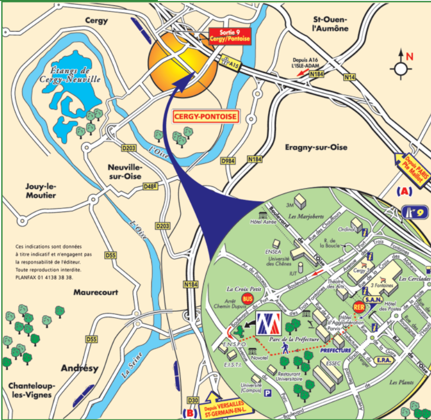
Depuis Versailles / St-Germain-en-Laye (B)